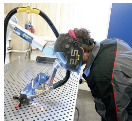
El operario puede trabajar directamente con el Cobot de Lorch sin necesidad de complejos y costosos equipos de protección.