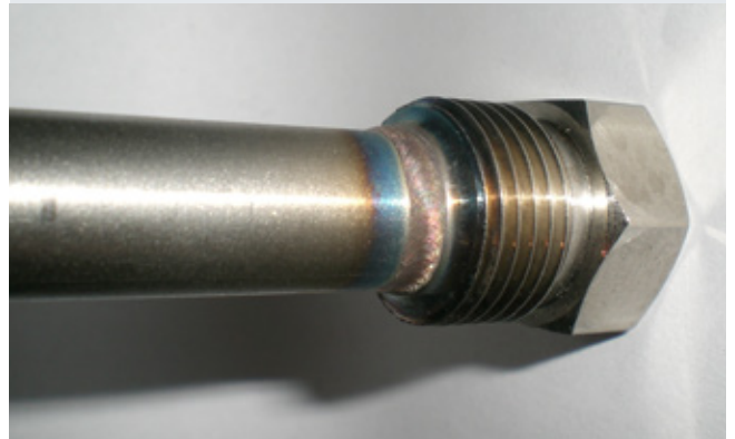
Dick-Dünn-Verbindung 0,7/5 mm