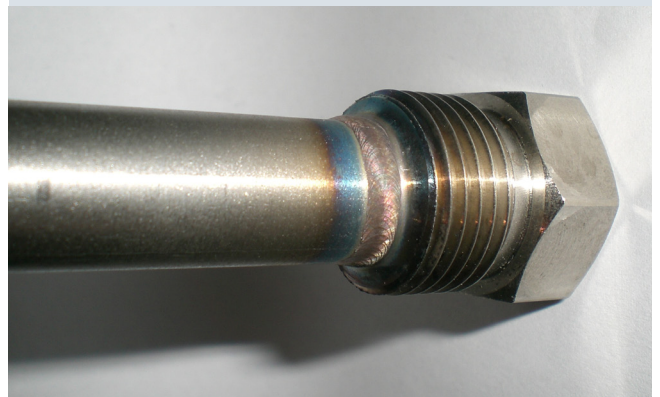
Unión de distinto grosor de 0,7/5mm