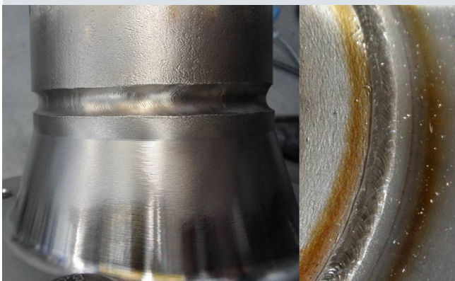
Brida de raíz